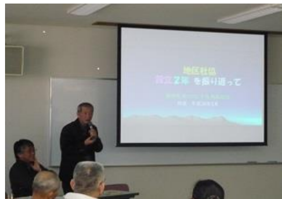
近江八幡市社協 学区（地区）社協交流会