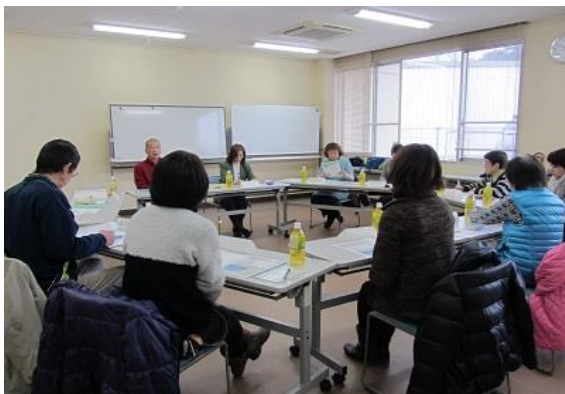
地域で考える交流会