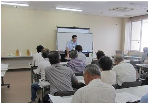
第1回サロン研修・交流会