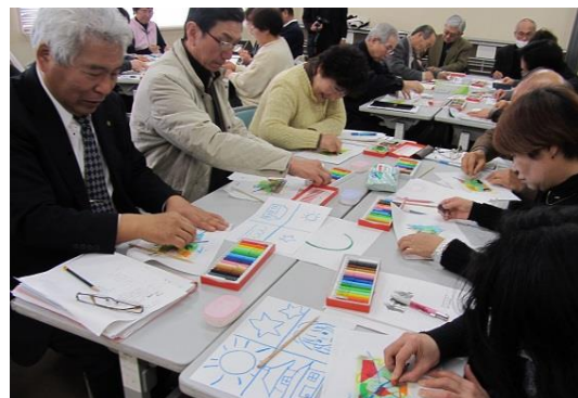
第2回サロン研修・交流会