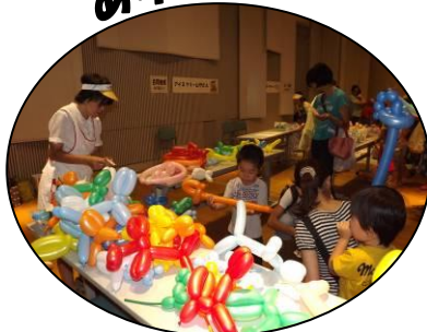
バルーンアートコーナー 「どれにしようかな?」