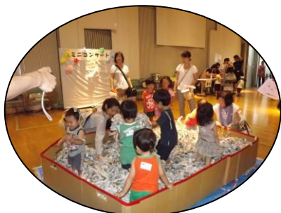
毎年大好評! 新聞紙プール(*^_^*)