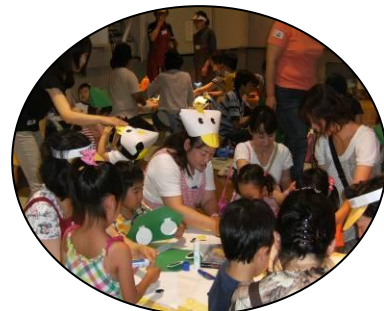
まかせて会員さんに教えてもらいながら「動物キャップ」作り。

まかせて会員さんには、5日間にわたる事前の準備会から当日の設営・各コーナーの担当・片付けまで本当にお世話になりました。