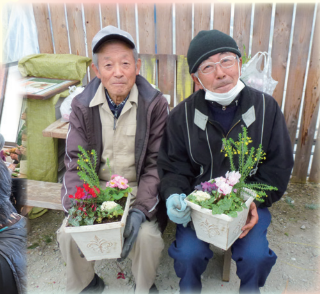
河原林町『正月用 寄せ植えづくり』