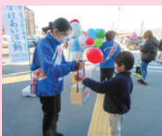
12月6日(土) 街頭募金活動

また、年末配分品として各団体からご寄付いただいた品物は、亀岡市内の福祉施設へ配分いたします。