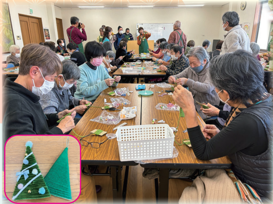
千代川町『小物（クリスマスツリー）作り』