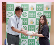
明治安田生命 亀岡営業部 からの寄付(社員の皆様で集 めていただいた物品)