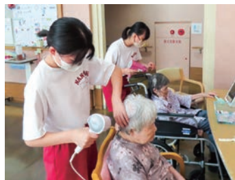
ガレリアかめおかデイサービスセンター 亀岡友愛園デイサービスセンター