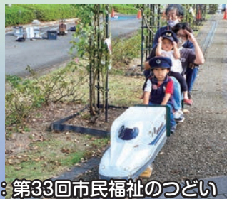
写真: 第33回市民福祉のつどい