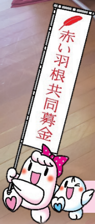
「令和3年度赤い羽根共同募金助成事業」 歌の会どり〜む（篠町）