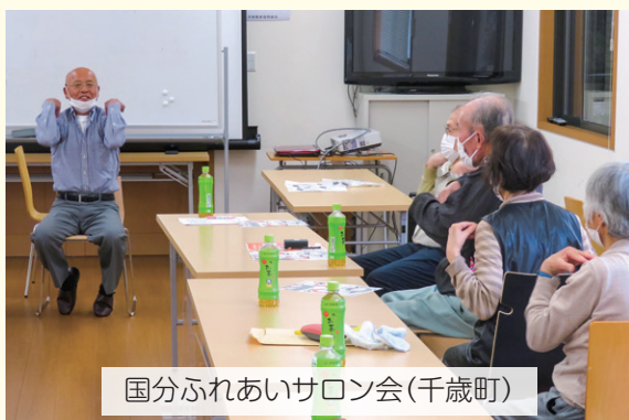
国分ふれあいサロン会(千歳町)