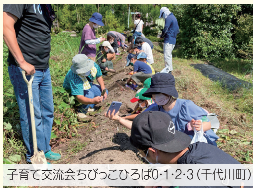
子育て交流会ちびっこひろば0・1・2・3(千代川町)