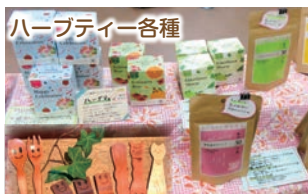
顔つきスプーン&フォーク（フェリーチェ）