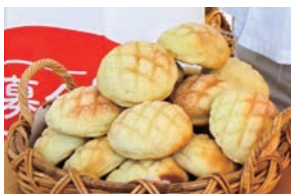
メロンパン（天然酵母パン グリム）