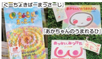
紙芝居絵本（たんぼぼ）