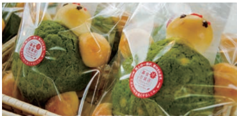
ふくかめパン（松花苑ワークスおーい）