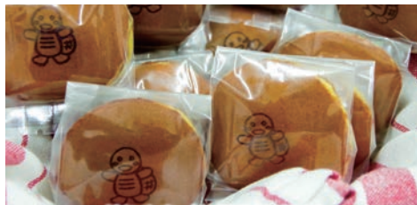
どらやき（和菓子処 匠大）