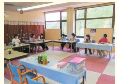
西別院町(べついいいききサロン)