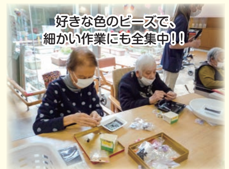
好きな色のビーズで、細かい作業にも全集中！！