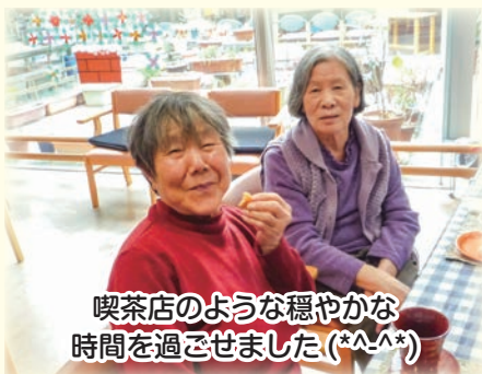
喫茶店のような穏やかな時間を過ごせました(*^_^*)

今年も皆さんと一緒に迎えることができ職員一同、大変嬉しく思っています。コロナウイルスの影響もあり、今までのように外出することが困難な中、感染予防対策をしっかりと行った上で、引き続きデイサービス内で楽しんでいただける行事やレクリエーションを考案していきます。