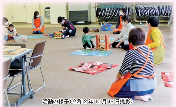
活動の様子(令和2年10月16日撮影)