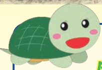
亀岡市社協マスコット ぶいくがめちゃん

コロナ禍でも、できることを自分たちのペースで…。 顔を合わせて気軽に話せるきかづけ作りと健康づくりのために (ふれあいネット西つつじ)