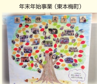
年末年始事業(東本梅町)