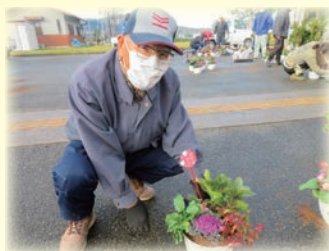
年末年始事業(河原林町)