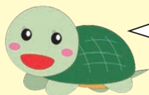
亀岡市社協マスコット ぶくがめちゃん

ガレリアかめおか芝生広場の西側にある「ふれあいプラザ」内に事務局があります。 お車でお越しの方は国道9号沿い農林センター(旧農業総合研究所)の交差点を縦貫道方向に曲がり、一本目の道を左折してください。