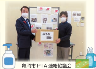
亀岡市PTA連絡協議会(亀岡市内小・中学校などで集めていただいた物品)よりの寄付