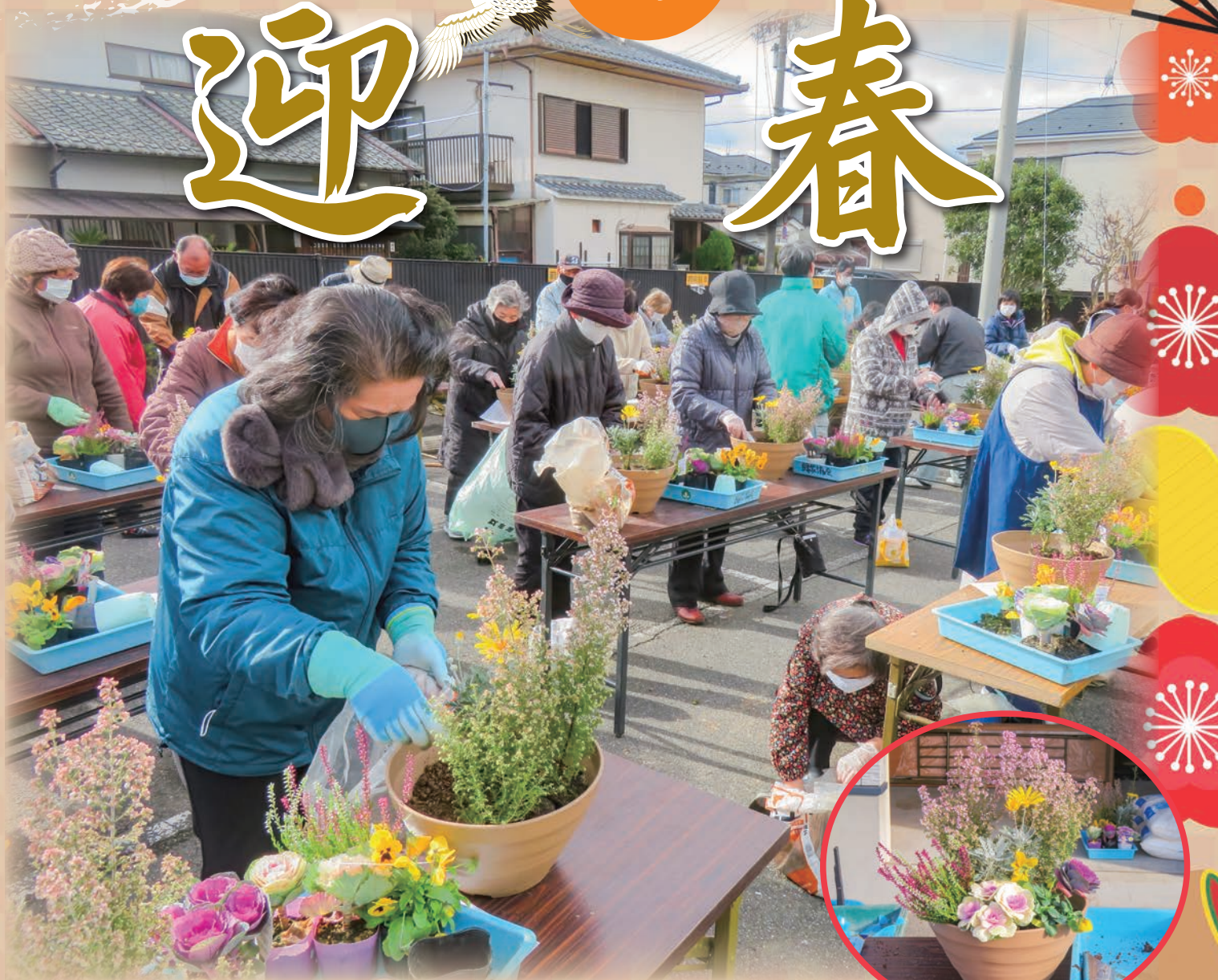
東つつじヶ丘自治会 / 寄せ植え「令和2年度歳末たすけあい運動 年末年始事業」(令和2年12月20日実施)