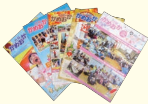
広報誌「社協かめおか」

～支え合い・助け合いのある顔のみえるまち・かめおか～の実現に向けて、市民の皆様には社協の役割・活動の理解をより深めていただくために、広報、啓発活動を積極的に行い法人の運営強化・人材育成にも努めています。また、車いす・ベッド・レクリエーショングッズの貸出を行っています。