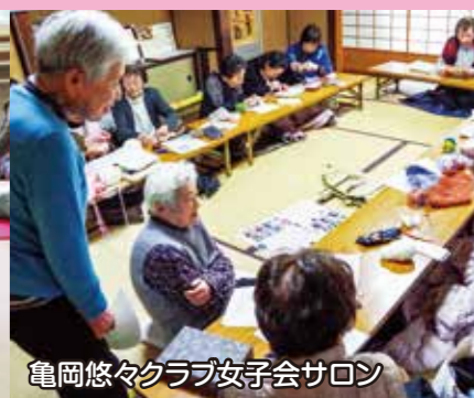
下矢田町あさひが丘自治会