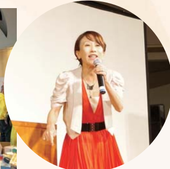
松野明美さんの講演