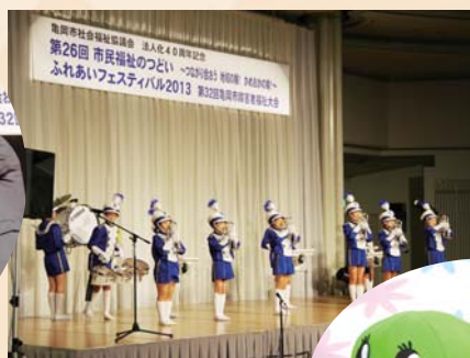
南つつじヶ丘マーチングバンド