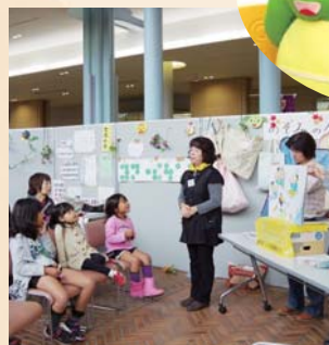
ボランティアグループによる紙芝居