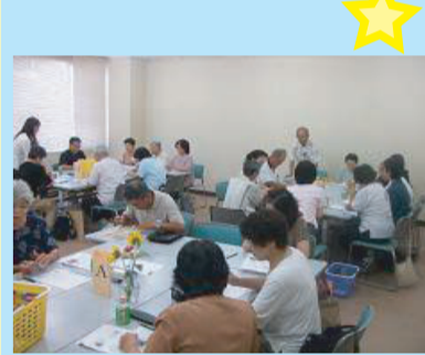
↑ ふれあいサロン交流会