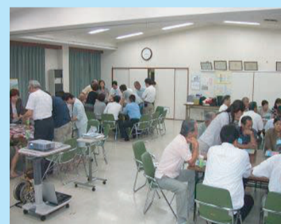
↑ 地域福祉活動推進のワークショップ