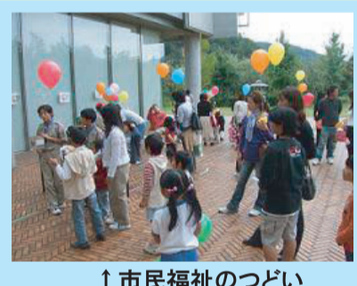
↑ 市民福祉のつどい

亀岡市社会福祉協議会では住民のみなさんや関係団体の協力を得ながら様々な事業を行っています。社協の活動は普段はなかなか身近に感じられないかもしれませんが、みなさんのご協力・ご参加をいただいて地域のくらしや福祉を充実させる為、事業展開しています!