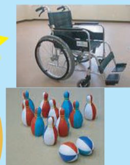
↑ 介護機器・レクレーショングッズ貸出事業

亀岡市社会福祉協議会では住民のみなさんや関係団体の協力を得ながら様々な事業を行っています。社協の活動は普段はなかなか身近に感じられないかもしれませんが、みなさんのご協力・ご参加をいただいて地域のくらしや福祉を充実させる為、事業展開しています!