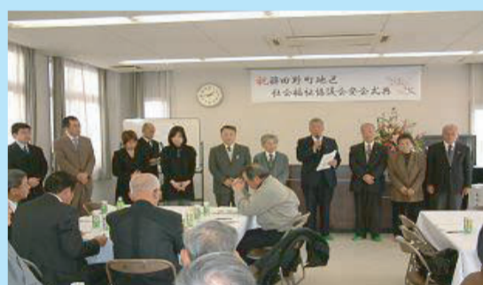
↑ 地区社会福祉協議会の立ち上げ・活動支援