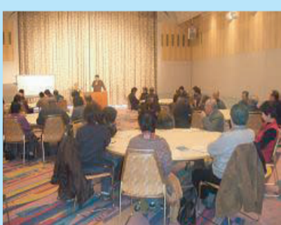
↑ ボランティア養成講座