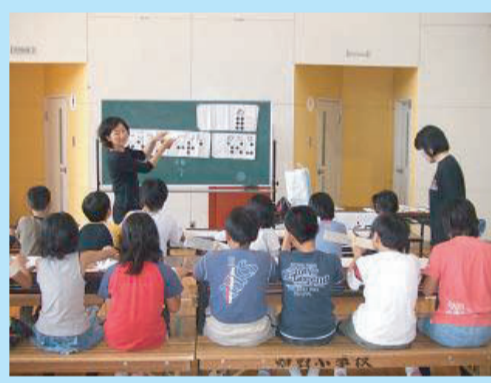
↑ 社会福祉体験学習(小中学校)