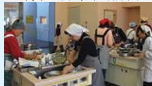
市民講座や交流会等の啓発事業