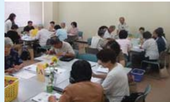
地区社協・サロンの立ち上げ・活動支援