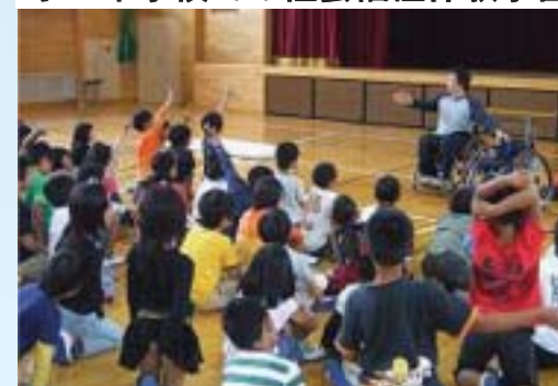
小・中学校での社会福祉体験学習